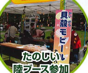
たのしい 陸ブース参加 Free Activities on The Shore