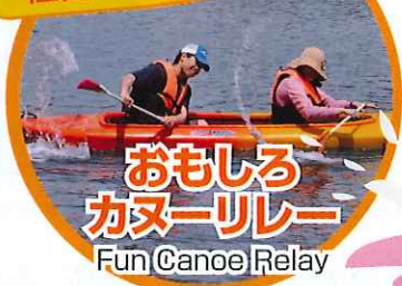
おもしろ カヌーリレー Fun Canoe Relay