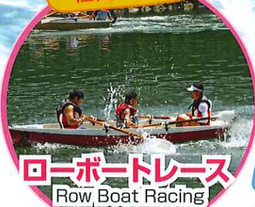
ローボートレース Row Boat Racing